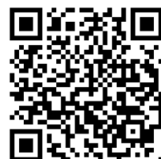
Vidéo de démonstration